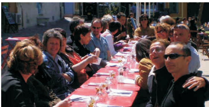
25 personnes présentes sur la terrasse ensoleillée d'une place sympathique de Marseille.